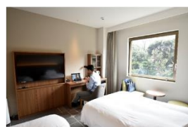
▲ホテルメッツ目白