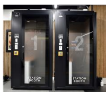
▲ STATION BOOTH