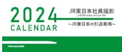
<JR 東日本の引退車両>