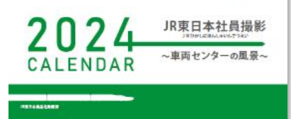
<車両センターの風景>