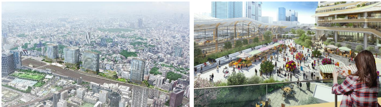
< TAKANAWA GATEWAY CITY のイメージ >

MICE 施設、オフィス、商業等を含む複合棟 I および高輪ゲートウェイ駅周辺エリアを 2024 年度末（2025 年 3 月）に開業し、その他の棟（複合棟 II・文化創造棟・住宅棟）および各棟周辺エリアを 2025 年度中に開業します。