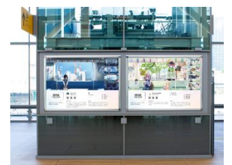
< 展示イメージ >