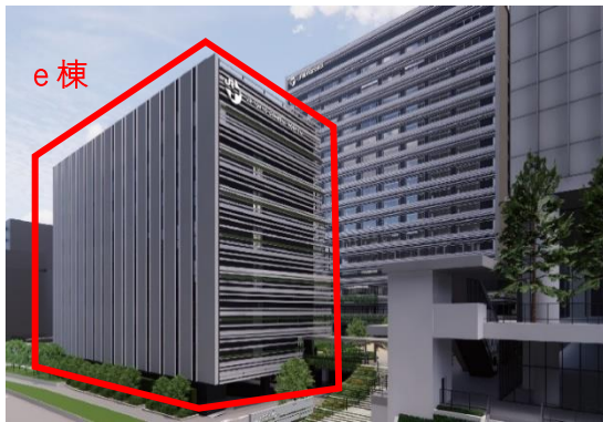
JR 東京総合病院 建替え等完成時の外観 イメージ