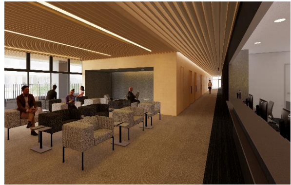
新たな人間ドックセンター待合 イメージ