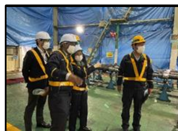
コース別研修(車両メンテナンス)

カリキュラムは講義、JR 東日本および他機関の施設・設備の視察、コース別研修の約 2 か月間で構成されます。また鉄道に関する知識・技術を学ぶことにとどまらず、日本文化を体験する機会も設けています。