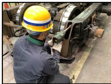
台車枠の組立作業