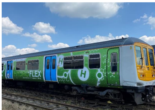
研究分野例：脱炭素に向けた水素車両の開発

バーミンガム大学鉄道研究・教育センター (BCRRE) は、バーミンガム大学内に組織する欧州最大級の鉄道研究教育機関です。英国において鉄道産業界との連携を行う英国鉄道研究イノベーションネットワーク (UKRRIN) のリーディングパートナーであり、世界クラスの研究、教育、イノベーションを世界に提供することをめざしています。鉄道産業界と連携して専門家によるサポートを実施し、鉄道業界内の起業・イノベーションを促進しています。