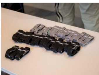
バイタルデータの計測・分析