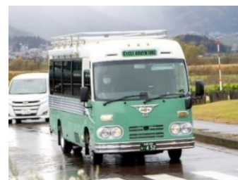
サイクルバス運行