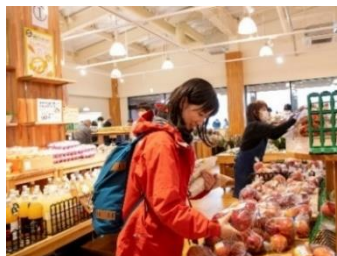
道の駅 地域産品との接点