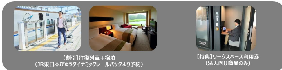
【割引】往復列車+宿泊 (JR東日本びゅうダイナミックレールパックより予約)