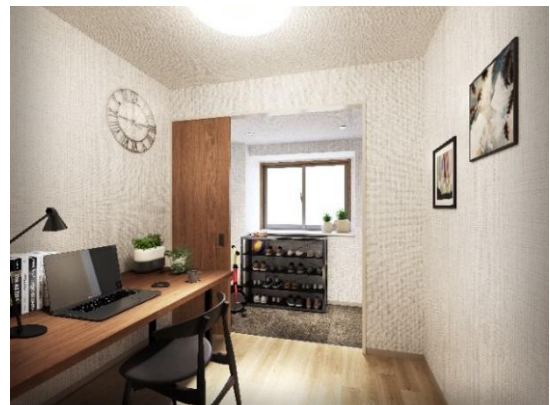
リモートスペース イメージ (リノベーション後)