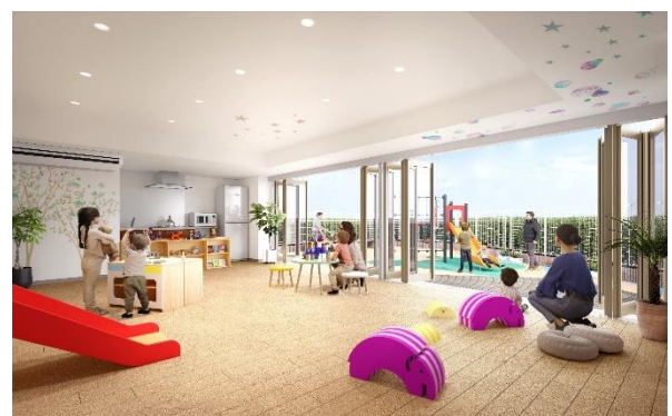
キッズスペースイメージ (リノベーション後)

「HAPPY CHILD PROJECT」は JR 東日本グループの子育て支援事業の総称です。駅型保育園などの施設開設や親子で参加できるイベントの開催など、子育て中の家族を応援する幅広い取り組みを進めています。