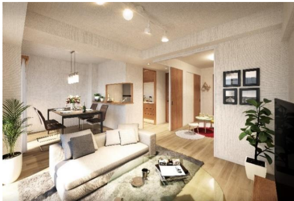
リビング イメージ (リノベーション後)

エントランスは、オートロック化・高画質防犯カメラ設置によるセキュリティ向上、デザイン性の高いルーバー設置や外構部植栽リノベーションによる美観向上など、全面改修を実施します。室内については、キッチン・トイレの更新や暖房換気乾燥機付浴室へのアップグレード、和室の洋室化（一部）等により居心地の良さを高めます。そのほか、機械式駐車場修繕工事など先を見据えた各種修繕工事を実施します。