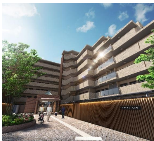
建物外観イメージ

CLASSEUM（クラシウム）は、『Classy（高級な、上質な、粋な）+ Museum（美術館、博物館）』の造語で、上質なライフスタイルが多彩に揃った、暮らしの博物館のような賃貸住宅へ」をコンセプトとしています。