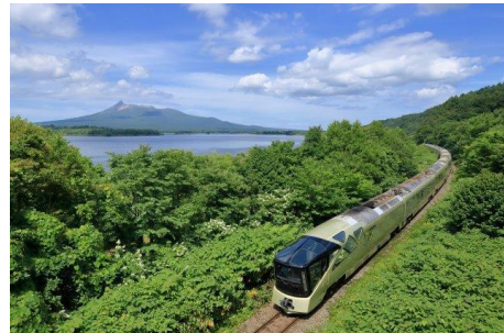
函館本線 仁山-大沼間