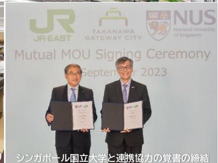
シンガポール国立大学と連携協力の覚書の締結