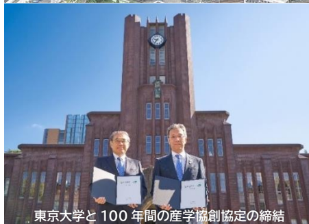
東京大学と100年間の産学協創協定の締結