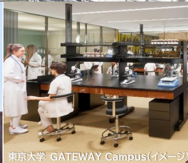
東京大学 GATEWAY Campus(イメージ)