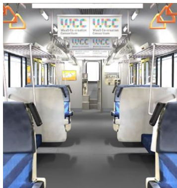
再現した E217 系車両のデジタル空間（イメージ）

鉄道古物は予約順で購入いただき、2024 年 12 月頃のお届けを予定しております。