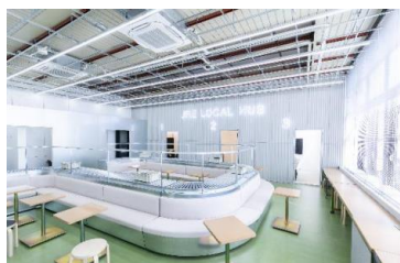
JRE Local Hub 燕三条 (上越新幹線 燕三条駅)