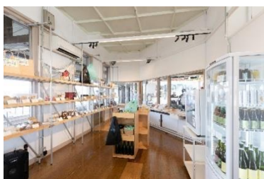
常磐線小高駅「無人駅舎醸造所」 (株式会社 haccoba)