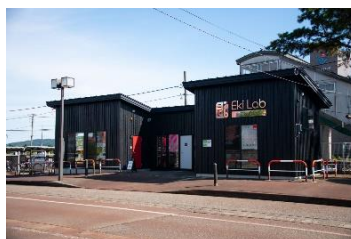
Eki Lab 帯織 (信越本線 帯織駅)