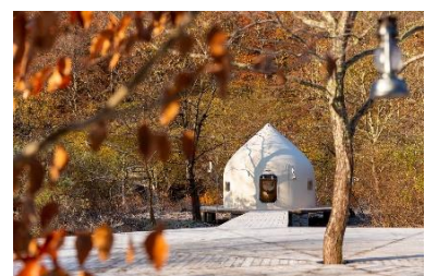
上越線土合駅「DOAI VILLAGE」 (株式会社 plower)