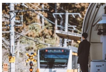
青梅線「沿線まるごとホテル」 (沿線まるごと株式会社)