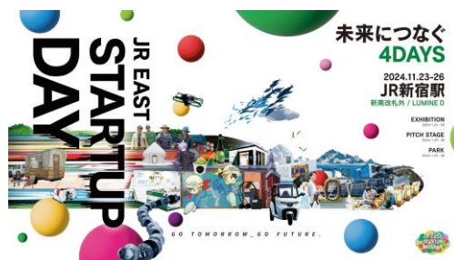
「JR EAST STARTUP DAY」キービジュアル

2017 年度から「JR 東日本スタートアッププログラム（以下、プログラム）」を毎年開催し、これまで 9 回開催しました（2022 年度から年 2 回開催）。スタートアップ企業のさまざまな優れたアイデアや最新技術などを、駅や鉄道、グループ事業の経営資源や情報資産を活用した協業の提案を募り、実証実験などを経て、実装していくプログラムです。