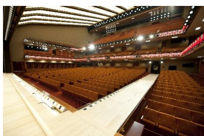
舞台下手より客席