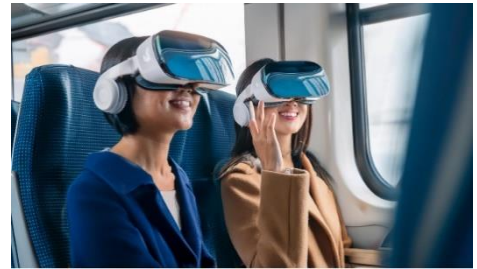
デジタルエンタメトレイン

MR等のデジタル技術を活用し、旅行の出発地から新幹線等の移動空間の中までも、関連コンテンツを楽しんでいただけるような新しい没入体験を創出していきます。