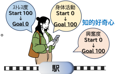
健康状態の可視化