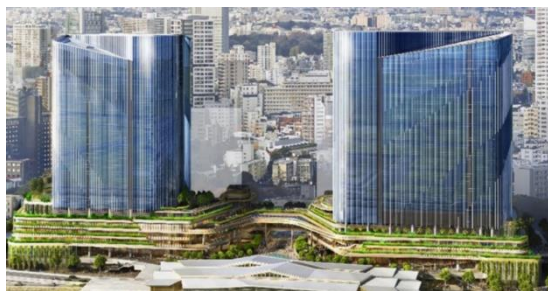
TAKANAWA GATEWAY CITY

松竹の「THE LINKPILLAR 1 SOUTH」への入居やビジネス創造施設「TAKANAWA GATEWAY Link Scholars' Hub」(LiSH)や「東京大学 GATEWAY Campus」との連携、複合文化施設「MoN Takanawa: The Museum of Narratives」での協業を通じ、両社グループの取り組みを加速させます。