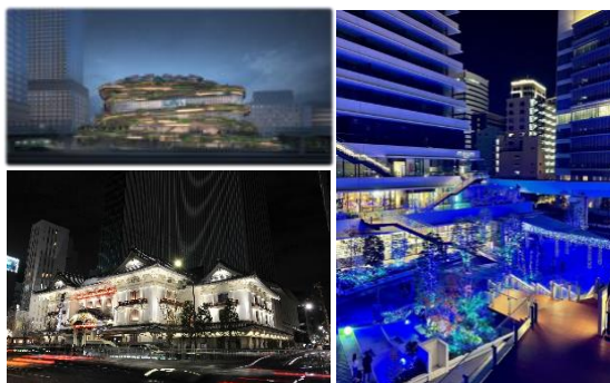
ナイトタイムエコノミー

両社の施設が東京湾に面して近接して立地する「高輪」、「浜松町・竹芝」、「東銀座」エリア一体で、地域の自然や文化施設・史跡や水上交通を活かした、文化的に豊かな夜時間の過ごし方を提案します。