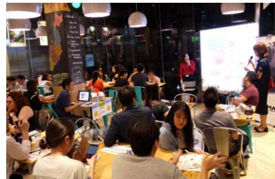
情報発信イベント