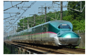
取扱商品イメージ