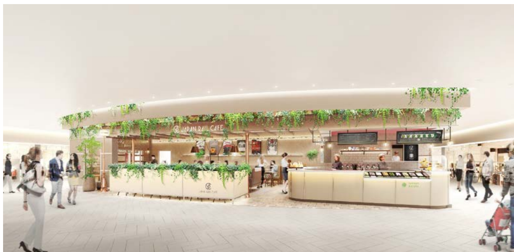
食堂専用列車をモチーフにした上質な空間（店舗イメージ）