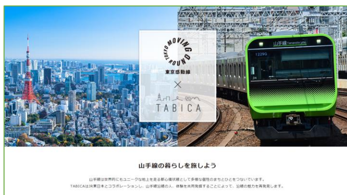
東京感動線×TABICA 特設サイト