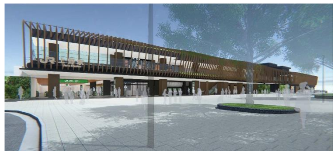
全面開業時新公園口駅舎外観イメージ

good spoon Cheese Sweets & Cheese Brunch （カフェ）※新業態