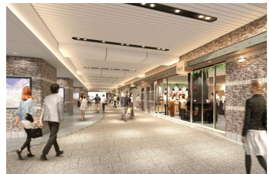
全面開業時改札外コンコース内観イメージ