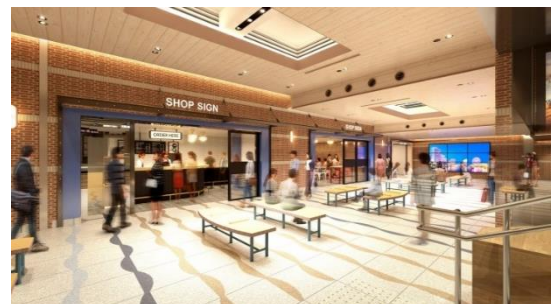
改札内コンコース及び店舗内観イメージ