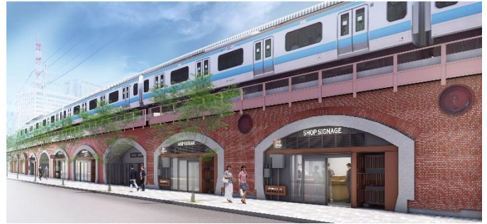
全面開業時駅舎および店舗外観イメージ