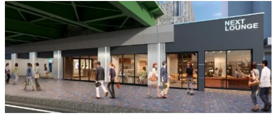
店舗外観イメージ