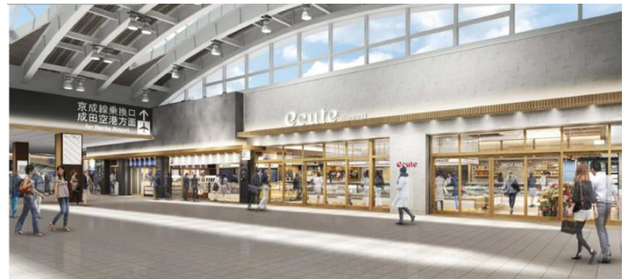
改札内コンコースおよび店舗内観イメージ