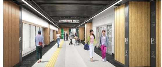
改札内コンコース内観イメージ