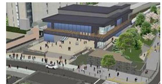
全面開業時西口新駅舎外観イメージ