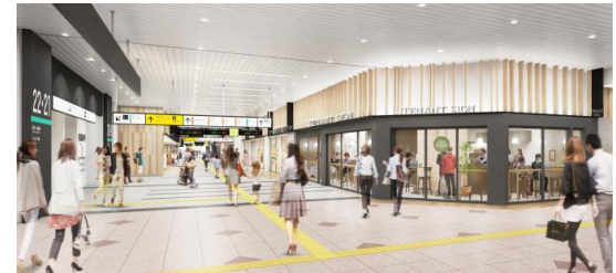
全面開業時改札内コンコース内観イメージ