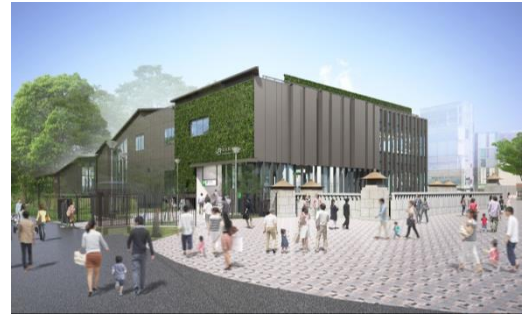
原宿駅新駅舎外観イメージ