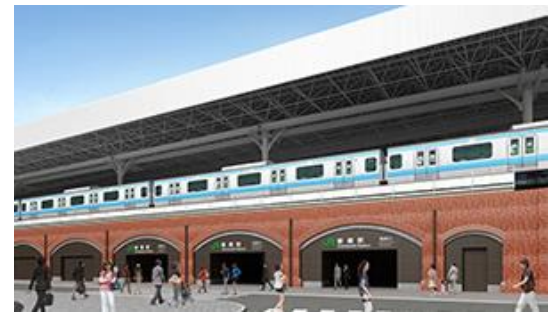
全面開業時駅舎完成イメージ