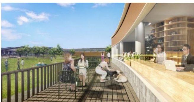
施設イメージ・現段階の予定であり今後変更になる可能性があります