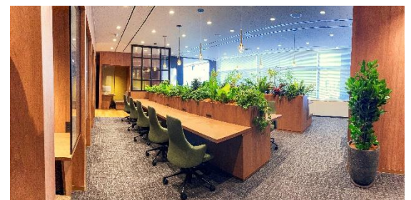
H 1 T 大手町