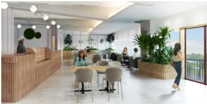
カフェを併設した一般ワークスペースイメージ・現段階の予定であり今後変更になる可能性があります

施設併設のカフェでは、淹れたてのコーヒーのほか軽井沢ならではのジュースや軽食の販売をいたします。オープンスペースでの飲食、お土産としてもお持ち帰りいただけます。