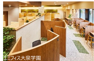
エミフィス大泉学園