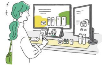
<JRE MALL Meet>

オンライン接客体験ができる「JRE MALL Meet」。お客さまのご興味や属性に応じて、商品をご紹介します。気になる商品は、オペレーターにご相談のうえ、JRE MALL でご購入いただけます。オンライン接客機能は先行して一部の「JRE MALL Car」で実証実験を開始し、機能拡充と設置箇所拡大を進めていきます。