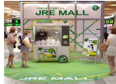
<JRE MALL Car>