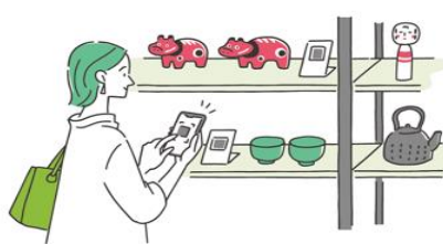
<ショールーム イメージ>