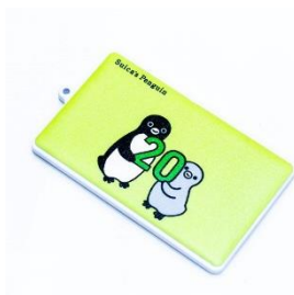
Suica のペンギン 20 周年記念カードケース W 1,925 円（税込・送料別）

11 月 18 日より、東京駅に設置する「JRE MALL Car」にて、期間限定でオペレーターによるオンライン接客体験ができます。あわせて JRE MALL 入会キャンペーンおよび Suica20 周年記念イベントなども同時開催します。