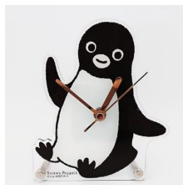
Suica のペンギン アクリル時計 4,730 円（税込・送料別）