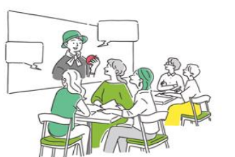
<コミュニケーションシアター イメージ>

②オンライン接客機能 設置されたモニターを介して、地域の生産者や販売者から接客を受けることができます。