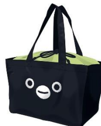
Suica のペンギン マルシエートバッグ 3,960 円（税込・送料別）