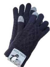
Suica のペンギン 手袋 M・Let's Go! 3,850 円（税込・送料別）