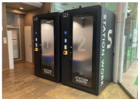
▲STATION BOOTH(軽井沢駅さわやかハット内)