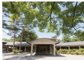
▲軽井沢プリンスホテル イースト