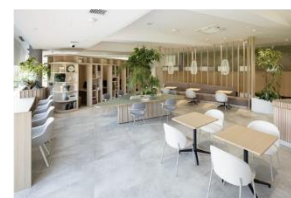
▲Karuzawa Prince The Workation Core