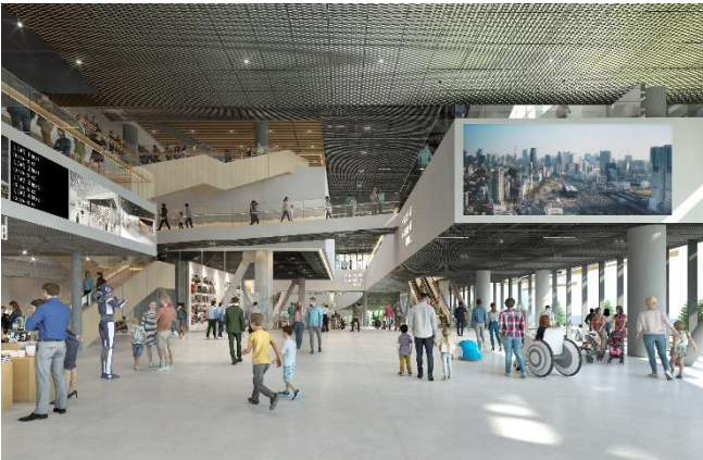
共用部エントランス

施設には約 1200 席のライブホール、約 1500 m 2 の展示室のほか、約 300 m 2 のオルタナティブスペース、約 200 m 2 の畳空間、足湯と水盤のある屋上庭園等の充実した共用部を備える計画です。プログラムのキーワードは「文化を生み出す」「未来をつくる」「伝統をつなぐ」とし、日本全国および世界と連携した自主企画プログラムを展開します。