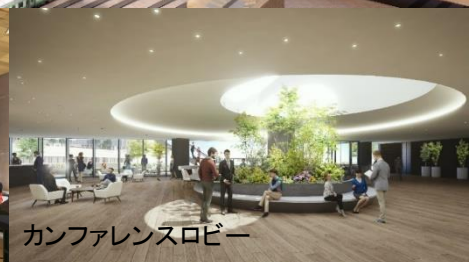
カンファレンスロビー