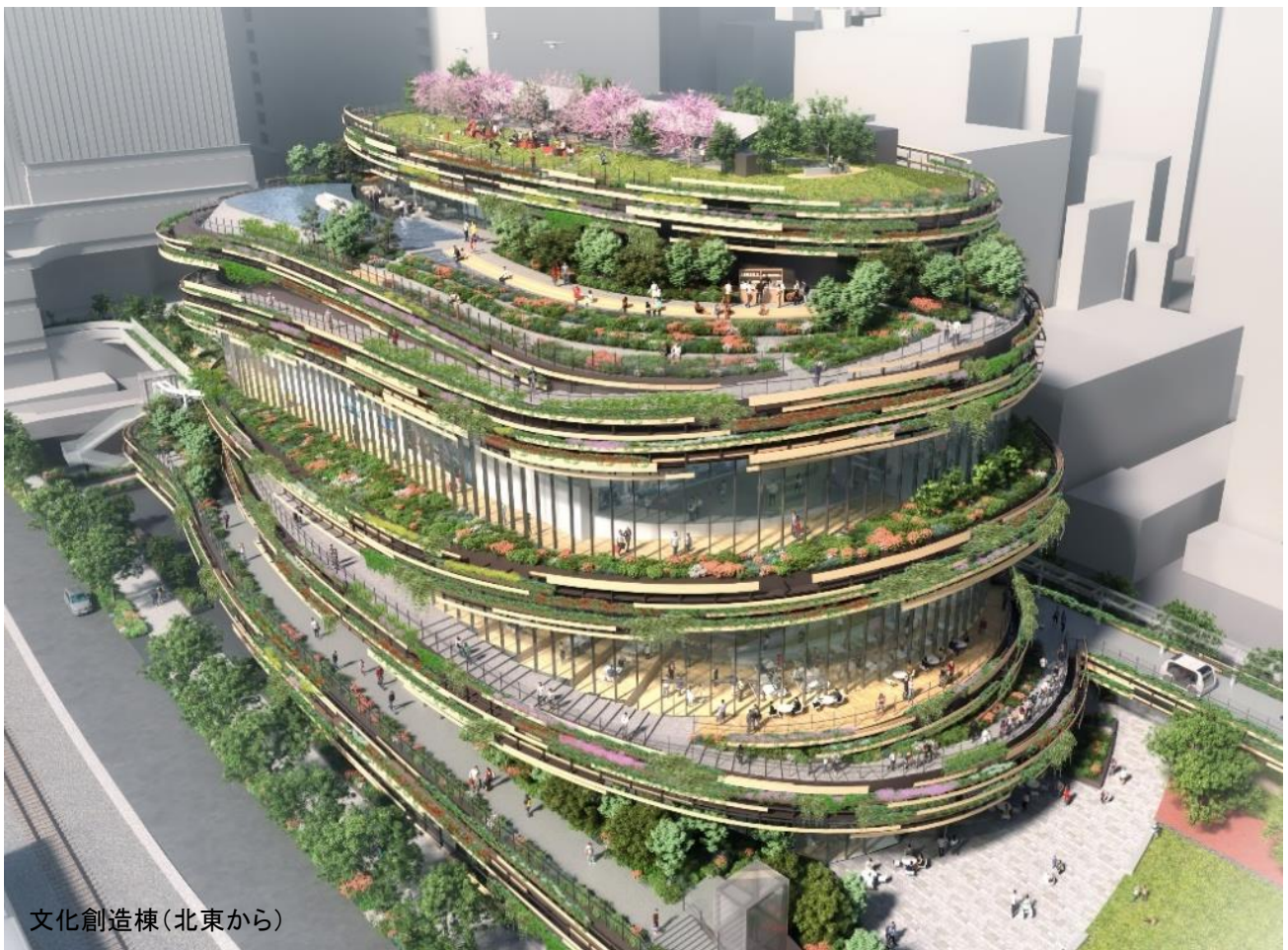
文化創造棟(北東から)