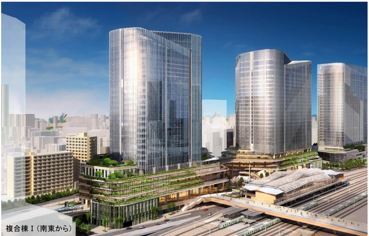
複合棟 I (南東から)