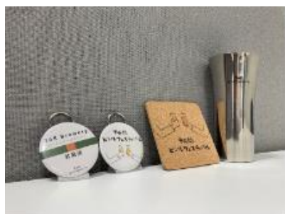
オリジナルグッズ

■参加方法：会場にて、①記念硬券 ②回数券引き換え時にお渡しする「中央線ビアルーレット」参加チケット ③コンプリート済スタンプラリー台紙のいずれかをご提示ください