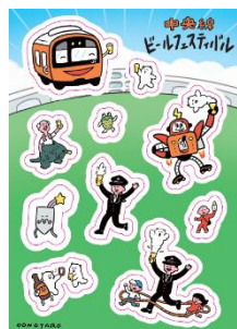
オリジナルシール