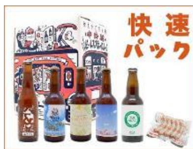
おうちで楽しむ中央線ビールフェスティバル202X（パック商品・記念硬券） ※2021年2月・12月発売。すでに販売終了しています。

26kブルワリーから 中央線ビールフェスティバル ゆき ビールが好きな方に限り有効 下車前送無効 中央線ビールフェスティバル2021実行委員会発行 本券は賞券に使用できません