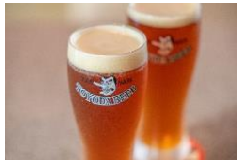
TOYODA BEER(BAR & DINING River Side)