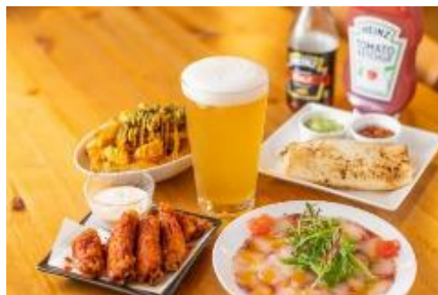
ビール工房(阿佐ヶ谷 20TAPS)