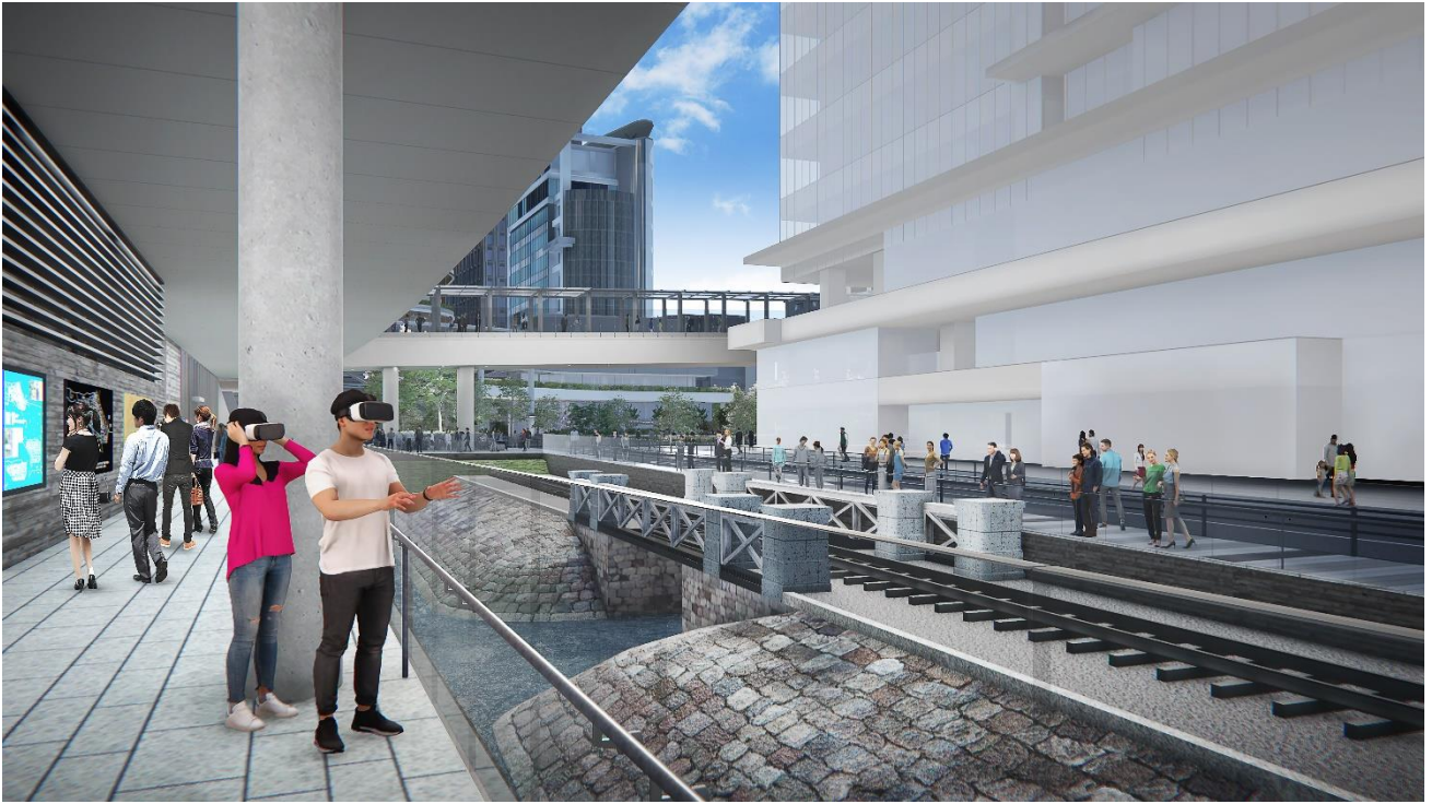
複合棟Ⅱの1階から第7橋梁部を眺めるイメージ