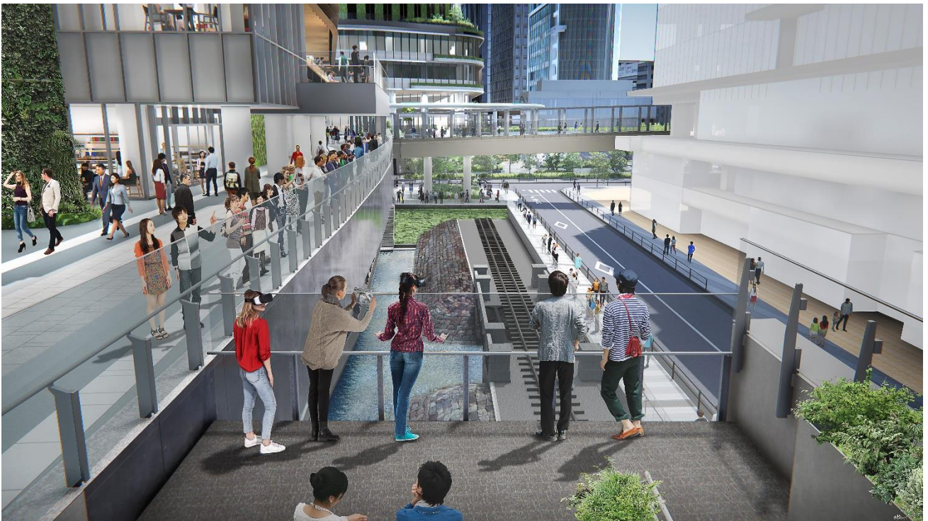
複合棟Ⅱの2階プロムナードから第7橋梁部を眺めるイメージ