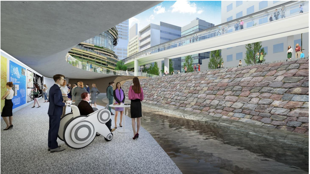
公園地下から高輪築堤跡を眺めるイメージ