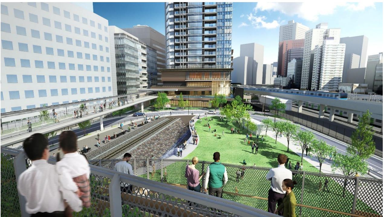
文化創造棟3階テラスから高輪築堤跡を眺めるイメージ