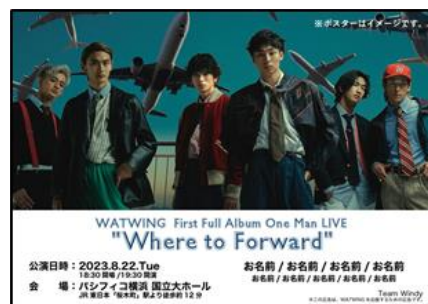
《ポスターイメージ》