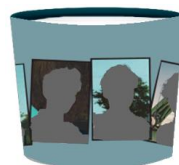
《カップホルダーイメージ》

また、オフィシャル画像を用いて、ファンご自身のお名前(ニックネーム)を入れた応援ポスターをライブ会場の最寄り駅や付近の乗換駅等に掲出できます。