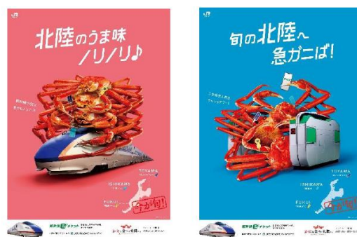
ポスターイメージ

https://www.jreast.co.jp/hokuriku-5star/kani/