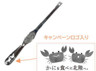
かにフォーク(イメージ)

ご乗車いただいたお客さま全員に「オリジナルかにフォーク」を車内でプレゼントします。