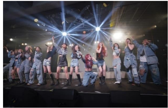
【『FYURA PROJECT』(エフユラプロジェクト)】