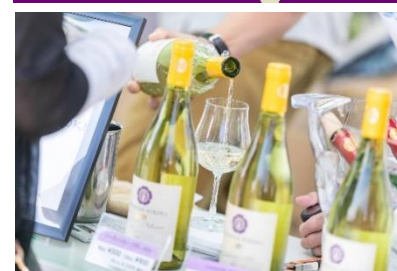
【ワインスタンドイメージ】