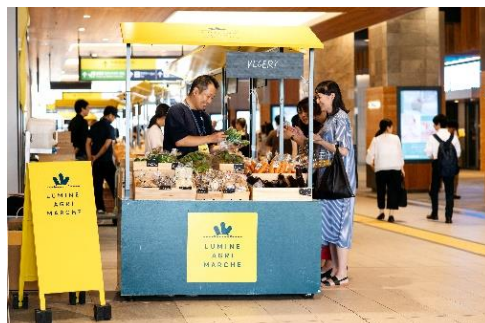
【LUMINE AGRI MARCHE イメージ】