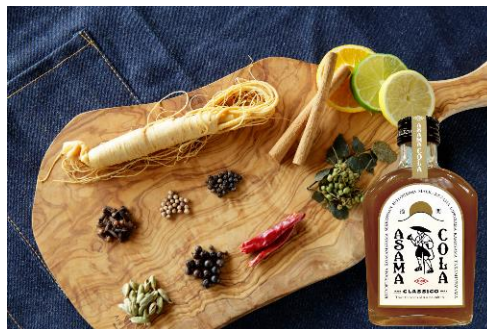
【浅間コーライメージ】