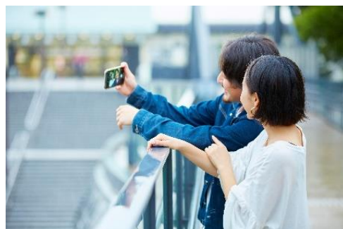
【フォトウォーキングイメージ】