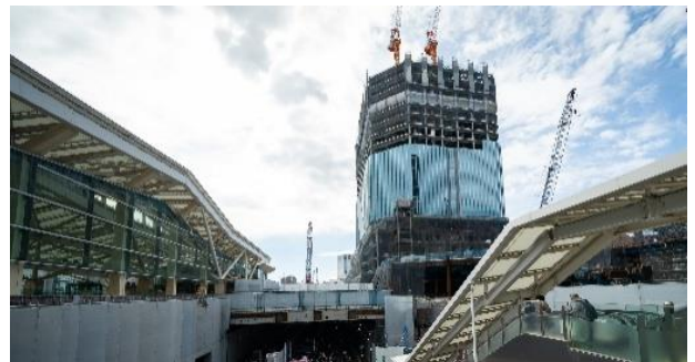
【TAKANAWA GATEWAY CITY 工事風景】