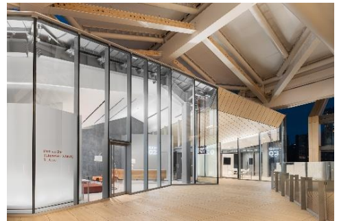
【Partner Base Takanawa Gateway Station イメージ】