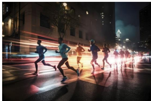
【ナイトランイメージ】