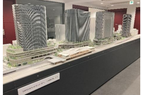
【TAKANAWA GATEWAY CITY 1/200模型】