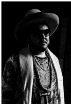
【SOIL&"PIMP" SESSIONS アジテーター"社長"】

また、16日(土)は歌声で世界を潤す女性ボーカルグループ『FYURA PROJECT』(エフユラプロジェクト)も登場! 休日らしい雰囲気の中、本格的な音楽を体験いただけます。