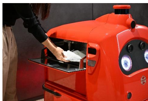
【自動運転の宅配ロボット「DeliRo(デリロ)」】

◆実施場所：高輪ゲートウェイ駅 改札外2階及び3階デッキ上 (実施場所は変更の可能性があります)