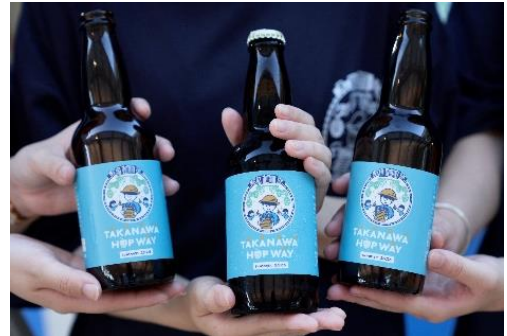
【TAKANAWA HOP WAYイメージ】

本イベントでは、実際に高輪エリアで収穫したホップに、地域の皆さまと収穫した高輪産はちみつを加えたオリジナルビールを数量限定で販売します。地産地消の希少なクラフトビールをぜひStation Parkでお楽しみください。