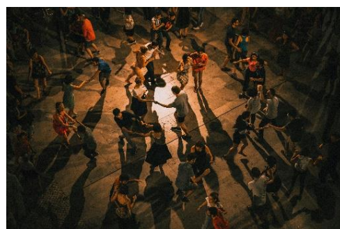
【ダンスパフォーマンスイメージ】