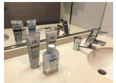
▲ 社内男性用トイレ