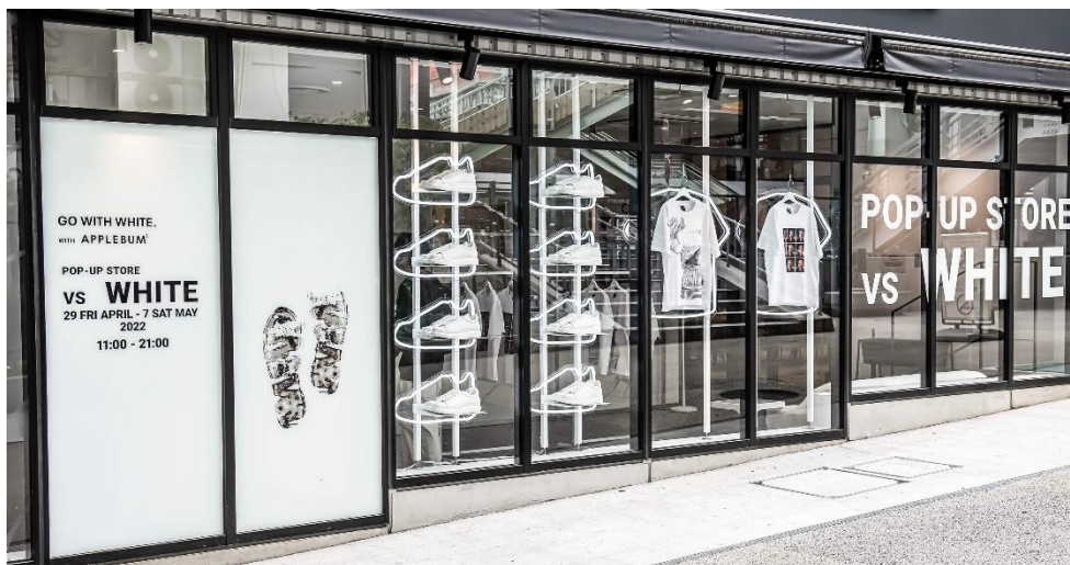
【図】「GO WITH WHITE.」POPUP ストア 出店イメージ

今回の「GO WITH WHITE.」POP UP ストアは、コンセプト開発から空間づくり、AIカメラによるデータ取得や分析・改善レポートの提供までを一気通貫でクレストグループ内でサービス提供を行った初めての事例となります。