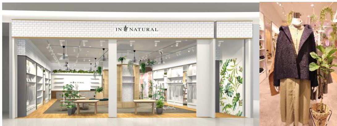
左図:イオンモールナゴヤドーム前店パース画像 右図:「esasy マネキン」(テラスモール松戸店)

既存産業を花形産業へ昇華するレガシーマーケットイノベーション(LEGACY MARKET INNOVATION、以下「LMI」)のプロフェッショナル集団クレストホールディングス株式会社(本社:東京都港区、代表取締役社長:永井俊輔、以下「クレストホールディングス」)子会社の、株式会社インナチュラル(本社:東京都港区、代表取締役社長:大木啓史、以下「インナチュラル」)は、2019年11月29日(金)、「インナチュラル イオンモールナゴヤドーム前店」(愛知県名古屋市東区矢田南四丁目102番3号)をオープンします。本店舗では、同じくクレストホールディングス子会社の株式会社クレスト(本社:東京都港区、代表取締役社長:永井俊輔、以下「クレスト」)の新サービスとして開発中の、マネキンの首部分に視認率計測トラッキングカメラ「esasy(エサシー)」を内蔵した顧客行動計測・分析用マネキン「esasy(エサシー)マネキン」を、全国2店舗目として導入します。