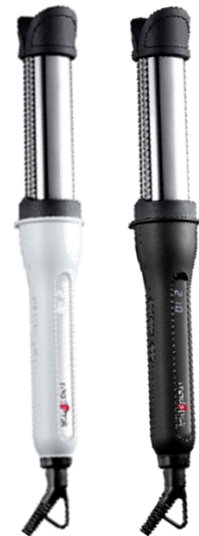
※画像はモッズ・ヘア アドバンス イージー・カール32mmです。