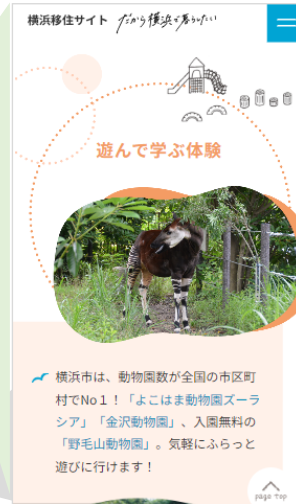
▲「子育て・教育」コンテンツ