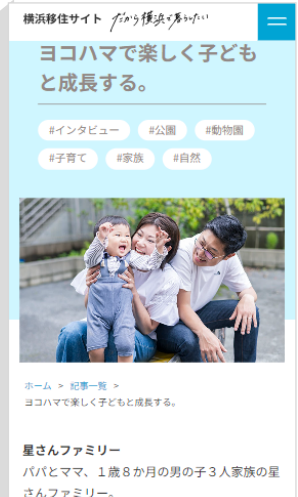
▲生活者インタビュー