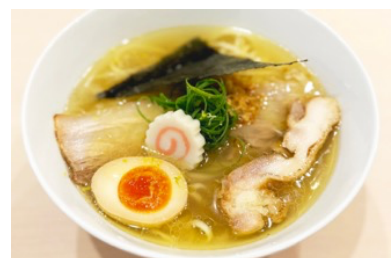
左から「中華そば 四つ葉」「中華そば 深緑」「らぁ麺 花萌葱」の提供メニュー