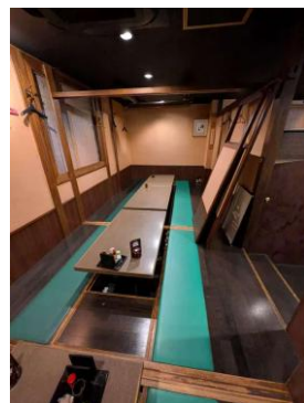
△居抜き工事前の様子

「もつ焼きばん」は、今後もFC展開を加速させ、今年6月中にはもう1店舗開店予定で、2027年3月までに30店舗の展開を目指しています。