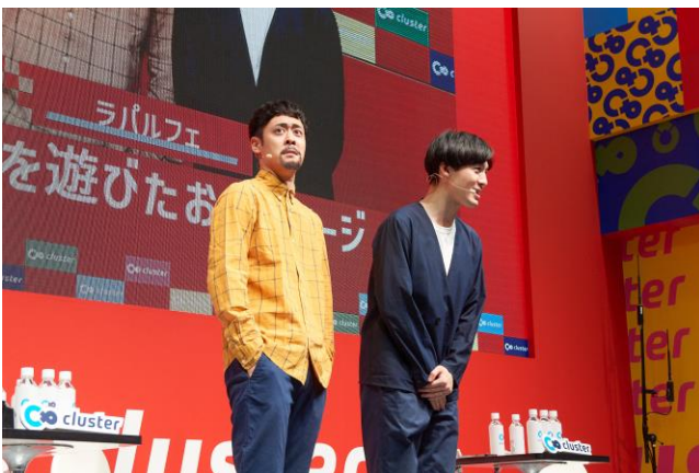
9/17(土)に登壇いただいた、芸人のラパルフェさん

©2022 Cluster, Inc. All Rights Reserved.