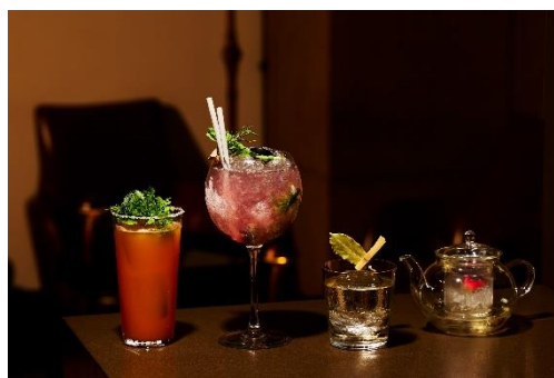
ルーフトップ バー 「ボタニカルガーデンカクテルズ」