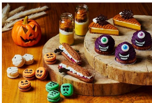
ペストリー ショップ 「ハロウィンスイーツ」