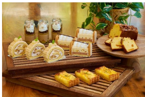
ペストリー ショップ 「洋梨スイーツ」