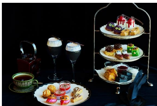
ザ タヴァン グリル&ラウンジ 「ハロウィンアフタヌーンティー」

「ザ タヴァン グリル&ラウンジ」では、ラウンジエリアにて、今にも動き出しそうなかわいらしい見た目とこだわりの北海道産の有機カボチャ“くりりん”を贅沢に使用したハロウィンアフタヌーンティーをご提供いたします。「ルーフトップ バー」では、“実りの秋”をテーマにボタニカルをふんだんに使用した、季節限定ミクソロジーカクテルを3種類考案いたしました。「ペストリー ショップ」では、9月は芳醇な香りにとろけるような味わいがお楽しみいただける秋の味覚、洋梨を使用したスイーツが、10月には毎年好評のハロウィンスイーツが登場。さらに今年は、ペストリー ショップとルーフトップ バーのコラボレーションによるスペシャルドリンク『パンプキン&ヘーゼルナッツ フラップ』をご用意いたします。「AO スパ&クラブ」では、“秋バテ”予防や温活に効果のある季節のハーブなどを使用した秋限定のトリートメントメニューをお楽しみいただけます。