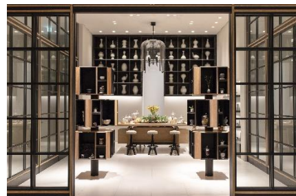
レセプションエリア