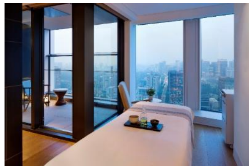
トリートメントルーム