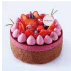
はなび 火花 - カシスショコラブラン - 3,046円(税込) 本体価格2,820円 直径12cm