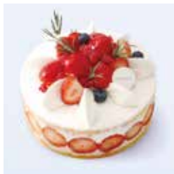
いちごびより 苺日和 - 夏いちごのクリームデコレーション - 3,780円(税込) 本体価格3,500円 直径15cm

お誕生日や記念日はもちろん、ケーキをお手土産に。というお客様のご要望にお応えしたHIBIKAケーキギフトボックスもご用意しております。