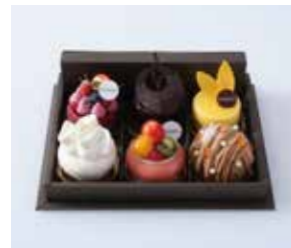
HIBIKA ケーキギフト(夏)6個入 4,677円(税込) 本体価格4,330円 価格は写真のお詰め合わせ内容です。 お好みのケーキでお詰め合わせいたします。