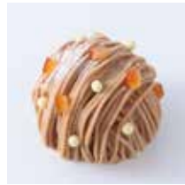
こもれば 木漏れ日 - モンブラン・オレンジ - 702円(税込) 本体価格650円