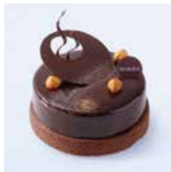
ほしつきよ 星月夜 - 2層のショコラ - 3,089円(税込) 本体価格2,860円 直径12cm