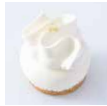
しらなみ 白波 - プロマージュ・パッションココロ - 692円(税込) 本体価格640円