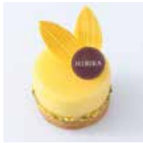
ひまわり 向日葵 - レモンのタルト - 692円(税込) 本体価格640円

向日葵(ひまわり)や火花、水風船など、その季節をモチーフにした色とりどりのケーキは、全部で10種。ビジュアルはもちろん、中の層にもこだわった職人の技がほどこされています。