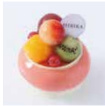
みずふうせん 水風船 - リュバブと苺のムース - 789円(税込) 本体価格730円