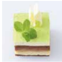
すずかぜ 涼風 - ミントショコラ・アナナス - 670円(税込) 本体価格620円