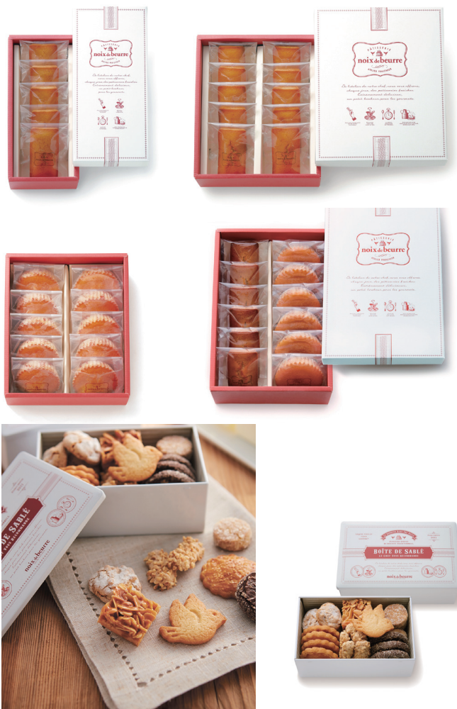
↑サブレ・アソルティ (イメージ)

【商品名】 サブレ・アソルティ 25個入 【販売価格】 税込2,376円 (本体価格2,200円) 【限定数】 400缶