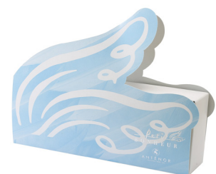
▲プティ・ボヌール 3個入