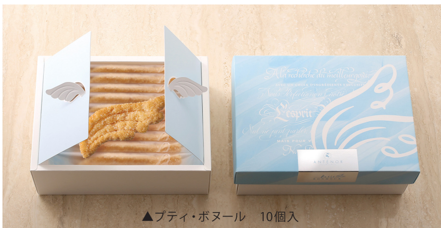
▲プティ・ボヌール 10個入

新ギフト『プティ・ボヌール』は、天使の羽をモチーフにしたサクサクの食感のパイです。ニュージーランドの広大な牧場で育てられた乳牛から作られた香り高いバターを幾重にも折り込み、職人が心を込めてひとつずつ焼き上げました。優しいペールブルーの天使の羽をあしらったパッケージの贈答用タイプと、ご自宅用の簡易パッケージをご用意しています。