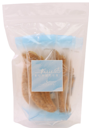
プチ・ボヌール 7個入