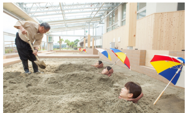
▲砂むし温泉が楽しめる休暇村指宿