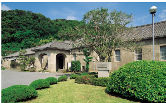
▲旧集成館 機械工場 (休暇村指宿から車で約2時間)