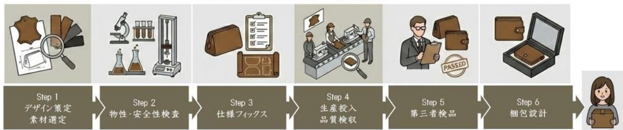
総合生産・品質管理プロセス Integrated production & Quality control process