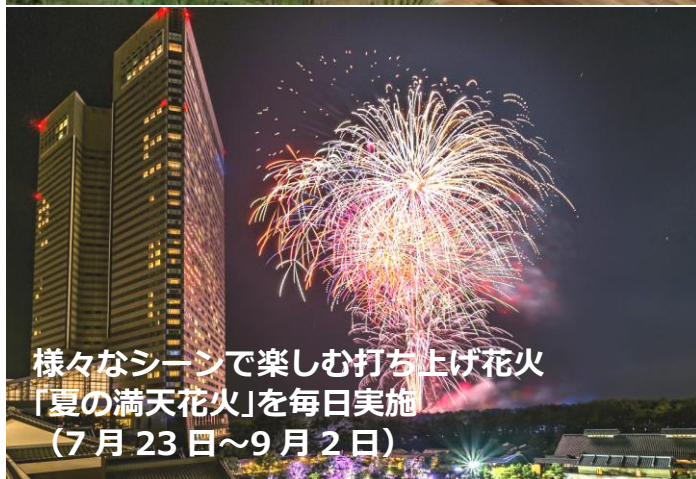
様々なシーンで楽しむ打ち上げ花火 「夏の満天花火」を毎日実施 （7月23日～9月2日）