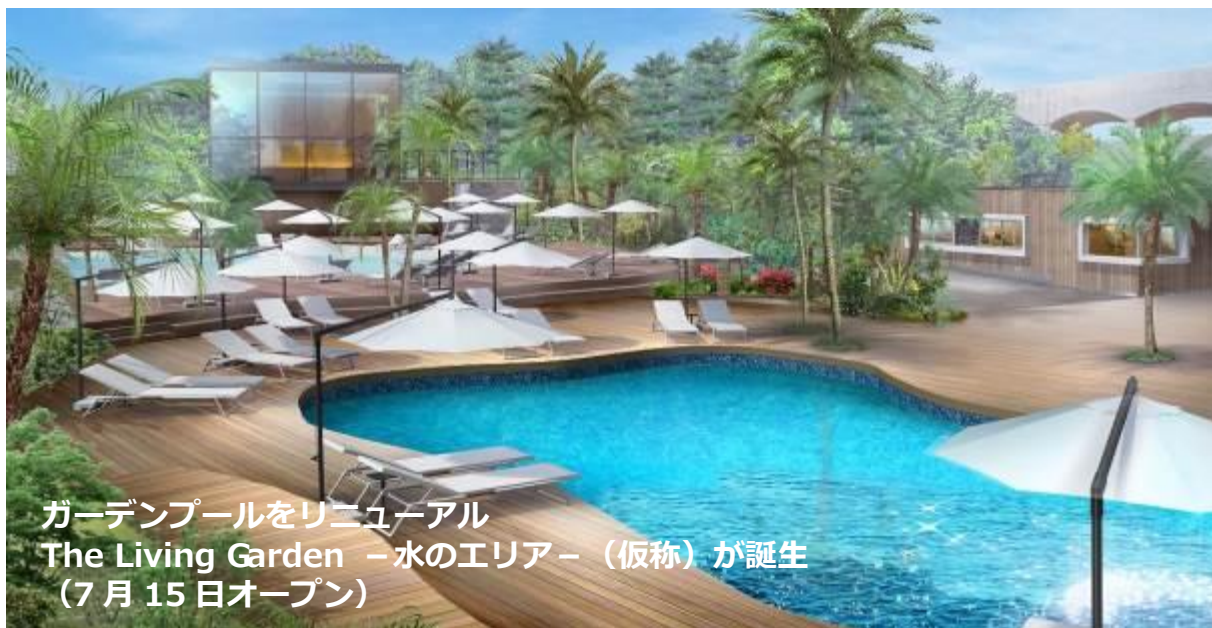
ガーデンプールをリニューアル The Living Garden –水のエリア–（仮称）が誕生 （7月15日オープン）