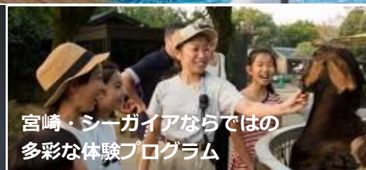
宮崎・シーガイアならではの 多彩な体験プログラム