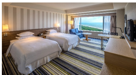
シェラトン・グランデ・オーシャンリゾート デラックスツイン 1泊朝食付き ペア1組 (1室2名)

宮崎の空と碧い海をイメージした、ひろびろ50㎡、全室オーシャンビューの客室。バスルームとベッドルームの間にガラス壁を設けることで自然光を取り入れた明るく開放的な空間です。