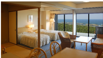
ラグゼーツ葉 和洋室 1泊朝食付き ペア1組 (1室2名)

宮崎の空と碧い海をイメージした、ひろびろ50㎡、全室オーシャンビューの客室。バスルームとベッドルームの間にガラス壁を設けることで自然光を取り入れた明るく開放的な空間です。