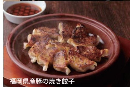
福岡県産豚の焼き餃子