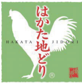
地域団体商標取得

本フェアで使用する食材は、福岡県の全面協力により実現した、新鮮で質の良い福岡博多の名物食材ばかり。例えば、噛むほどに旨味が増す「はかた地どり」や、甘みの強い玄界灘産の「天然真鯛」、海苔本来の豊かな香りと旨味が楽しめる貴重な「一番摘み福岡有明のり」、福岡のラーメンのために品種開発された小麦使用の「博多ラー麦ラー麺」…。それらを贅沢に使い、各店の料理長が一品一品手をかけて作る福岡博多うまかもんメニューは、まるで福岡博多でグルメ旅行しているような本格的な美味しさです。