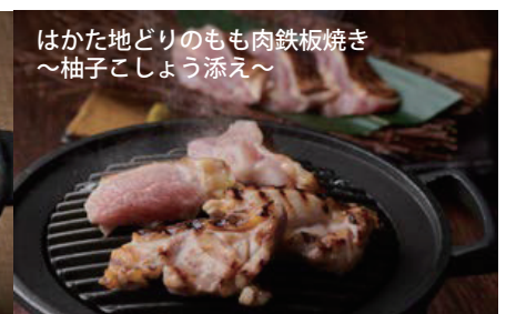
はかた地どりのもも肉鉄板焼き ～柚子こしょう添え～