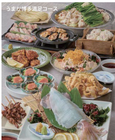
うまか博多満足コース

また、少人数での宴会やお食事には、アラカルトでのご注文がおすすめ。博多もつ鍋やはかた地どりのもも肉鉄板焼き、福岡県産豚の焼き餃子、ごま鯛をはじめ本格的な福岡博多グルメがズラリ21種！一皿390円（+税）～とこちらもお値打ちです。そして、かごの屋で人気の食べ放題メニュー「ご馳しゃぶ」では、定番の二味鍋や一品料理、寿司、串揚げなどとあわせて、はかた地どりのチキン南蛮、明太子や貴重な一番摘み福岡有明のりなどの福岡博多うまかもん7品が食べ放題で楽しめます。