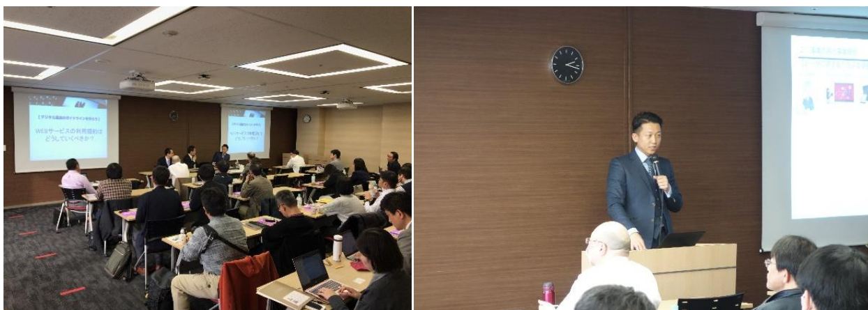
2018年3月3日に開催されたデジタル遺品に関するセミナーの様子

今後も、デジタルデータソリューションは、お客様のデータトラブルを総合的に解決するソリューションカンパニーを目指し、様々な取り組みを行って参ります。