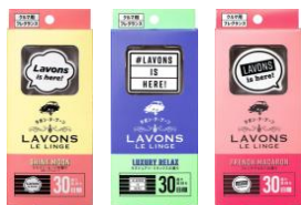
クルマ用フレグランス ゲルタイプ