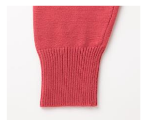
【着るたびにシャレボンで洗った場合】