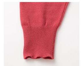
【洗わないで着続けた場合】