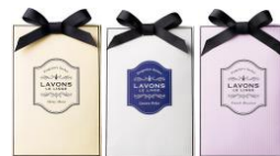
フレグランス ウォーター