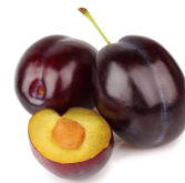
プルーンオイル (プルーン種子エキス)