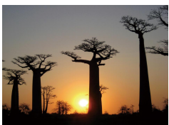
パオバブオイル (パオバブ種子油)

オイル本来の美容成分を引き立てるために、丁寧にコールドプレス製法で抽出したオイル。フェアトレード・トレーサビリティ・サスティナビリティの厳しい基準をクリアしたオーガニック認証の天然オイルで作りました。髪にも肌(角質層)にもスッと浸透して、軽い仕上がりで保湿効果を感じられます。世界中から厳選されたオイルを集めました。