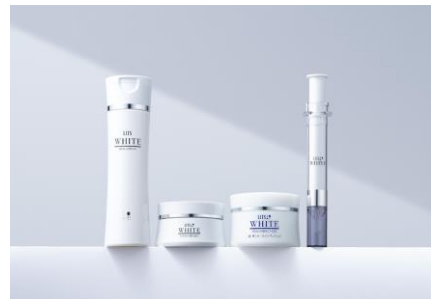
LITS WHITE(リッツ ホワイト)