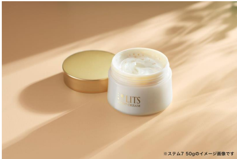
※ステム7 50gのイメージ画像です