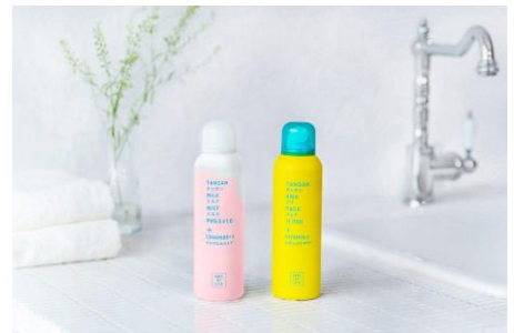
SHEE BY LITS(シー バイ リッツ)