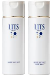
ローション 無香料/ リラックスハーブの香り 本体：190mL/1,298円 詰替：165mL/1,089円 ※詰替は無香料のみ