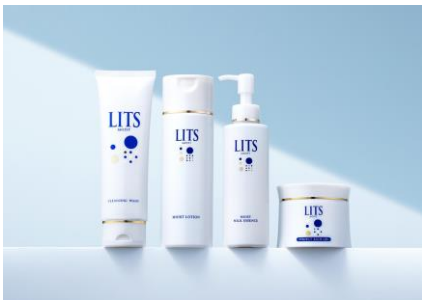
LITS MOIST(リッツ モイスト)