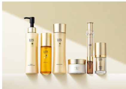
LITS REVIVAL(リッツ リバイバル)