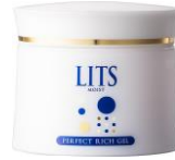
パーフェクト リッチジェル 90g/1,848円