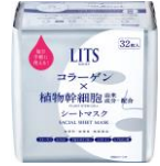
パーフェクト リッチマスク 7枚入り/550円 32枚入り/1,980円