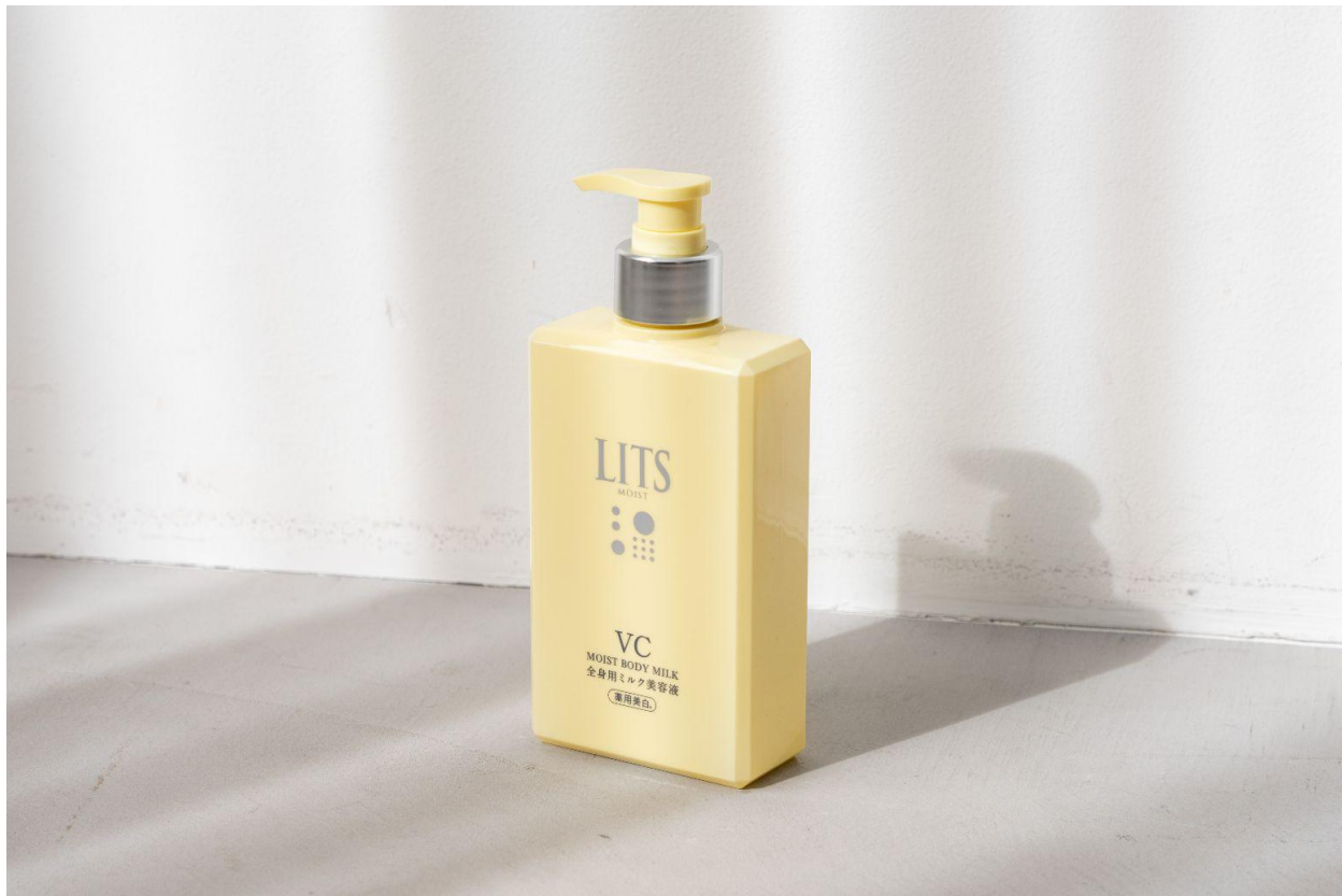
リッツ モイストC 薬用ボディミルク【医薬部外品】250mL ¥2,530(税込)

株式会社ネイチャーラボ（本社:東京都渋谷区）が展開する植物幹細胞コスメ ※4 ブランド『LITS(リッツ)』は、スキンケア発想の美白 ※1 & うるおいの「リッツ モイストC 薬用ボディミルク」を3月1日(土)より発売いたします。