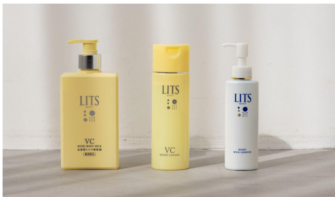
(左から) モイストC薬用ボディミルク、モイストCローション、モイストミルクエッセンス

人気の「モイストCローション」と1本で乳液と美容液の効果がある「ミルクエッセンス」の共通美容液成分をたっぷり配合。保湿効果の高いトリプルセラミド※10と2種のコラーゲン※11、たっぷりとうるおいのある肌へ導きます。